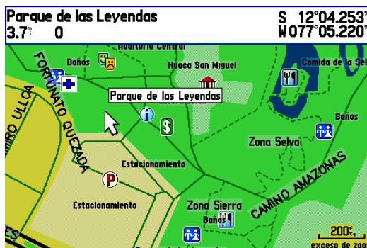
Detalle en C.Comerciales, Parques y Zonas de Trekking (Garmin gpsmap 276c)