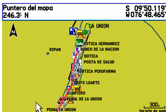
Vista de La Union, ruta Conococha - Huanuco