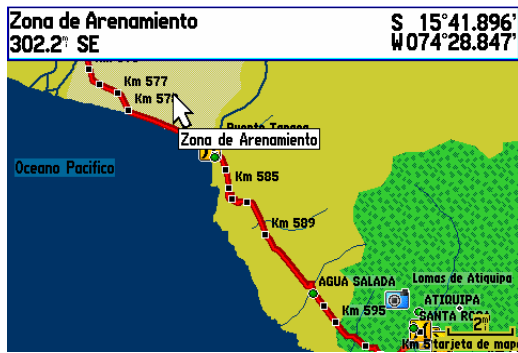
Información del Terreno (En un Garmin gpsmap 276c)